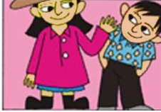
UYGUN ELBİSELER GİYMEK