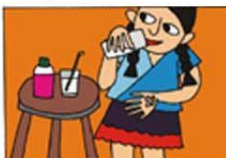
GEREKİĞİNDE İLAÇ ALMAK