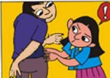
AZARLAMAYA, İTİLMEYE KARŞI KENDİMİZİ KORUMAK