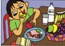
BESLEYİCİ GIDALAR YEMEK